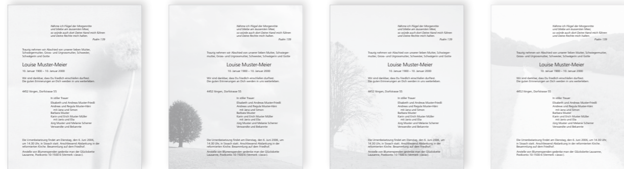
5 Sunnewirbel Einzelbogen 6 Baum Sommer Einzelbogen 7 Baum Winter Einzelbogen 8 Weg Einzelbogen