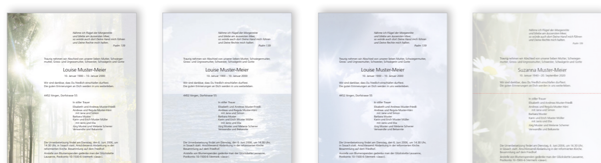
30 Lebenslicht Einzelbogen farbig 31 Ozean Einzelbogen farbig 32 Himmel Einzelbogen farbig 33 Blumenfeld Einzelbogen farbig